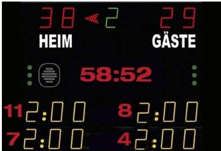
Abbildung 1: Beispiel Anzeigetafel

Das Anzeige-System in der Spielstätte muss eine öffentliche Zeitmessanlage sein, die von allen Zuschauerplätzen und insbesondere vom Zeitnehmer-/Sekretärstisch ohne Einschränkungen eingesehen werden kann. Werden auf der Anzeigetafel Zeitstrafen angezeigt, so müssen mindestens zwei Hinausstellungen pro Verein inkl. Spielnummer und Strafzeit (siehe Abbildung 1) angezeigt werden können.